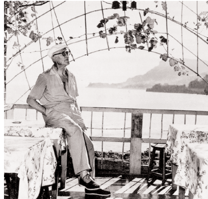
Le Corbusier en la terraza del restaurante L'Etoile de Mer.

Como consecuencia de lo anteriormente expuesto podemos intuir por qué la técnica instrumental, sometida a la incertidumbre, no interesa al capital que tiene por objetivo el aseguramiento de su inversión y la dirección de conseguir beneficios. Porque al fin y al cabo ¿qué produce más beneficios económicos, invertir en los medios que curan una enfermedad o investigar las causas que la producen?.