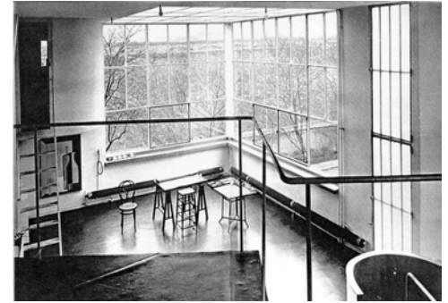
Maison Czenfant, Le Corbusier.

"Usted comprenderá bien que los sentimientos de respeto y de amistad que aún restan han sido dolorosamente dañados (.....) Me he abierto camino, con dificultad, y gracias a Dios sin usted, porque sería para mí un peso enorme tener con usted alguna deuda