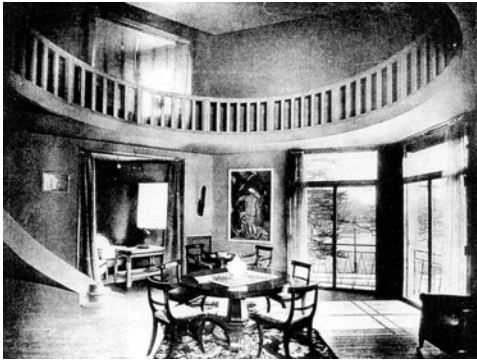
Maison Guat, Auguste Perret.

siglo XVIII, y por el contrario la transformación profunda que implica la solución corbuseriana. En la planta de la casa Guat prevalece la ordenación dieciochesca que impone las viejas normas burguesas de confort y privacidad: las pequeñas piezas ocultas de servicio, se someten en beneficio de la configuración y secuencia representativa de los espacios principales; la ordenación jerárquica -codificada como poché en L'Ecole Beaux-Arts- confiere al salón y galería superior del espacio en esquina, la máxima representatividad, aunque nada al exterior parezca anunciarlo. Resulta curioso que, en la veintena de casas y talleres de artistas que realizará Perret en el área de París, nunca antes ni después construyera una estancia como ésta en doble altura; también resulta insólito en Perret -aunque no será éste el único caso- el uso del revoco en la fachada y la cubierta plana transitable. ¿Es que acaso se veía influenciado el maestro por su más detestado discípulo?