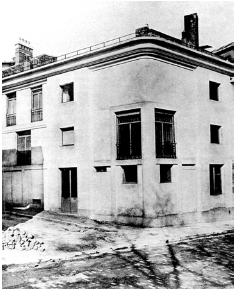
Maison Guat, Auguste Perret, Paris 1922.23.

cubisme realizado en 1918 junto al pintor Amédée Ozenfant será el primer detonante del distanciamiento. Dos años después aparecerán los primeros números de la revista L'Esprit Nouveau , y tanto en esta publicación como en el diario Paris-Journal se irán produciendo los cruentos ataques y réplicas entre ambos arquitectos en una rivalidad que durará hasta mediados de los años veinte.