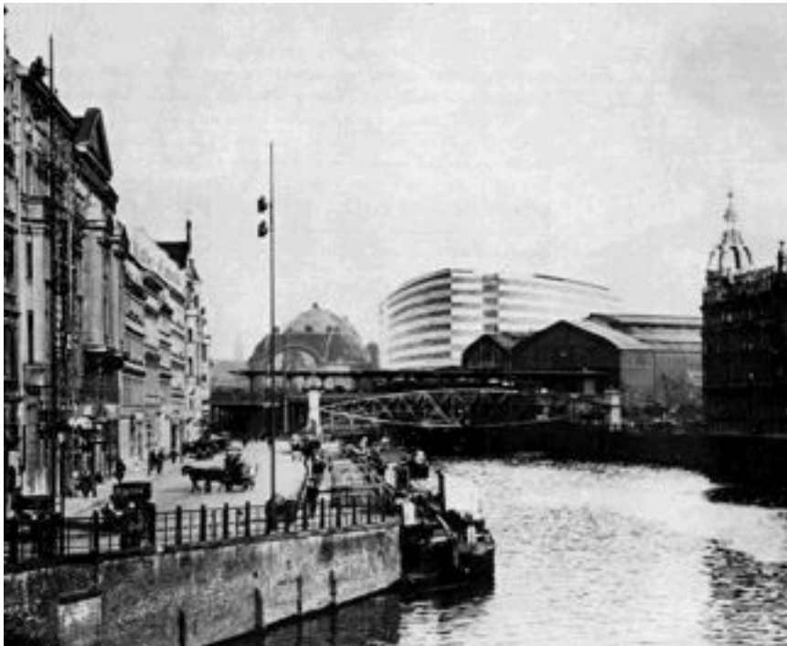
Perspectiva de edificio de oficinas en Friedrichstrasse, Berlín, 1929.

explicación de lo visible, en este caso la realidad física de lo urbano. La experiencia de la ciudad deja de ser una vivencia coherente y continua, y se ofrece como una acumulación de estímulos a la espera de una estructura de orden que le dé sentido.