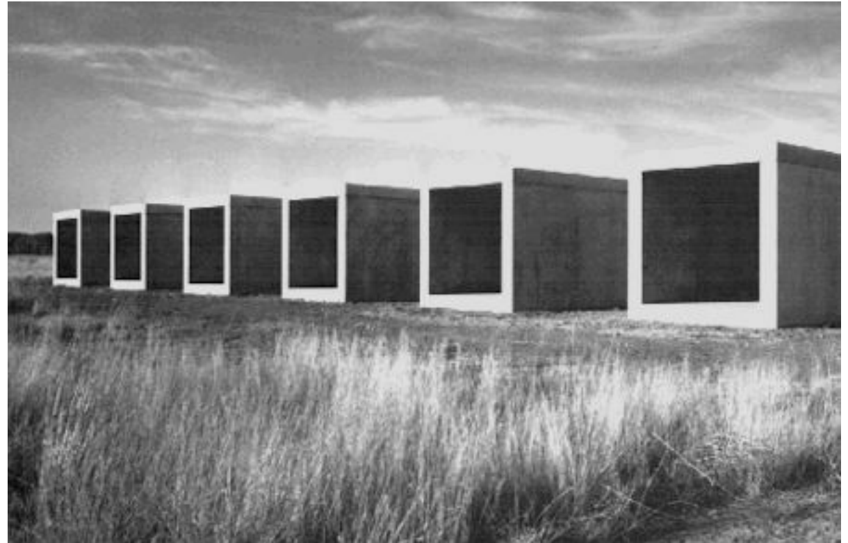
Chinati Foundation, Marfa, Texas Fifteen concrete works.

Puede avanzarse ya, por tanto, que las incursiones de Judd en el campo de la arquitectura vendrán mediadas por estos dos principios, es decir, la creación del espacio por medio de la repetición de unidades equivalentes y una poética de los materiales que afirma la relación necesaria entre forma y contenido. Principios estos que, paradójicamente, habían sido pilares fundamentales en la arquitectura americana los años cincuenta.